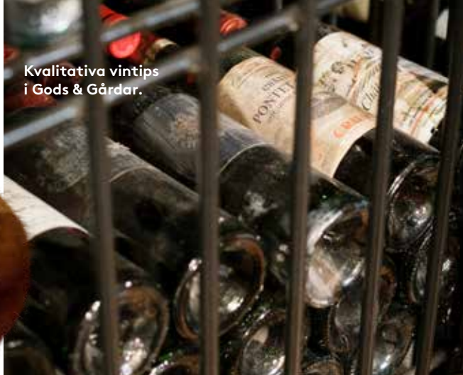
Kvalitativa vintips i Gods & Gårdar.

Italienska Alessi, som vanligtvis ses i vita metaller, lanserar en ny kollektion. Under namnet Extra Ordinary Metal har formgivare tolkat klassiska Alessiobjekt i mässing, med en yta som flörtar med etruskisk gulsmideskonst – granulering.