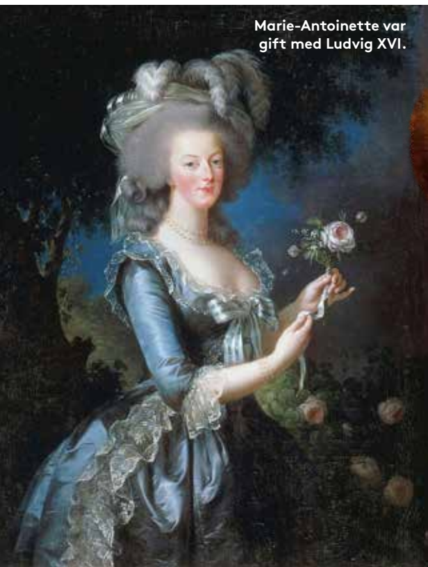
Marie-Antoinette var gift med Ludvig XVI.