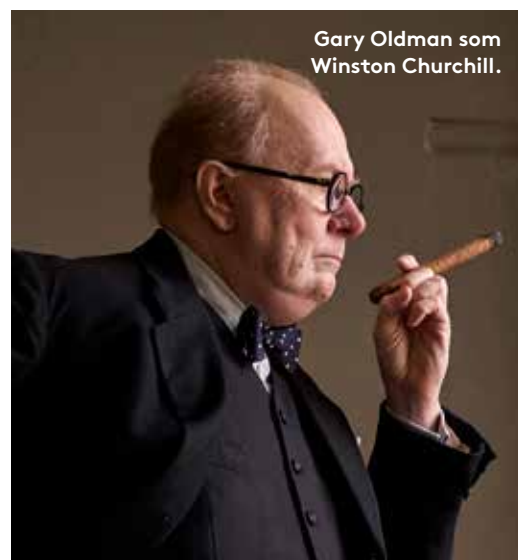
Gary Oldman som Winston Churchill.

Sveriges äldsta jaktbutik, Widforss jakt och natur, har flyttat från sin välbekanta adress på Fredsgatan i Stockholm. Numera ligger butiken i stället i Stenladan vid Steninge slott i Märsta norr om Stockholm. Widforss jakt och natur har funnits sedan 1729.