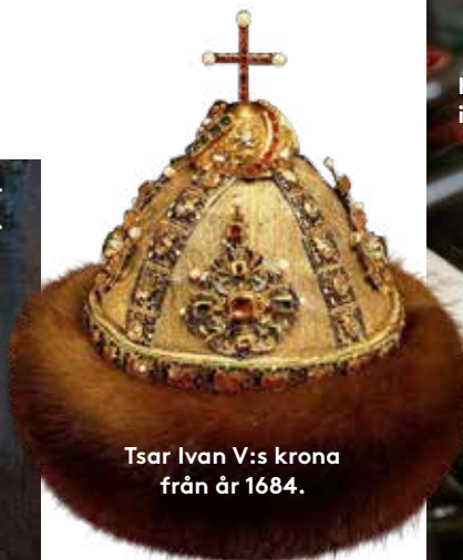
Tsar Ivan V:s krona från år 1684.