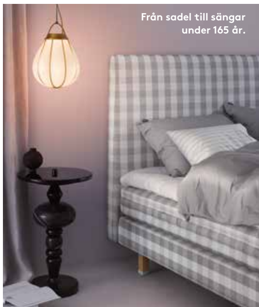
Från sadel till sängar under 165 år.

Bit för bit restaurerar Statens fastighetsverk tre anslående blyinfattade fönster på Manillaskolan, numera Campus Manilla, på Djurgården i Stockholm. Fönstren, troligen från sent 1800-tal, finns i den forna kyrksalen och består av hundratals glasbitar. Under arbetet tas varje fönsterdel ner och rengörs och skadade bitar ersätts med gammalt glas innan de sätts samman igen.