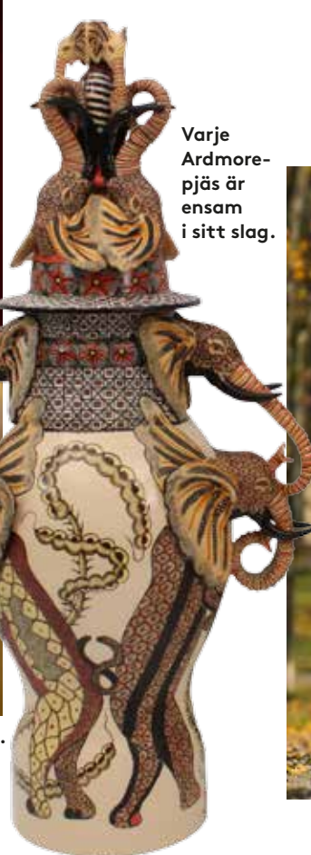
Varje Ardmore-pjäs är ensam i sitt slag.