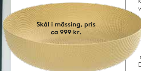
Skål i mässing, pris ca 999 kr.